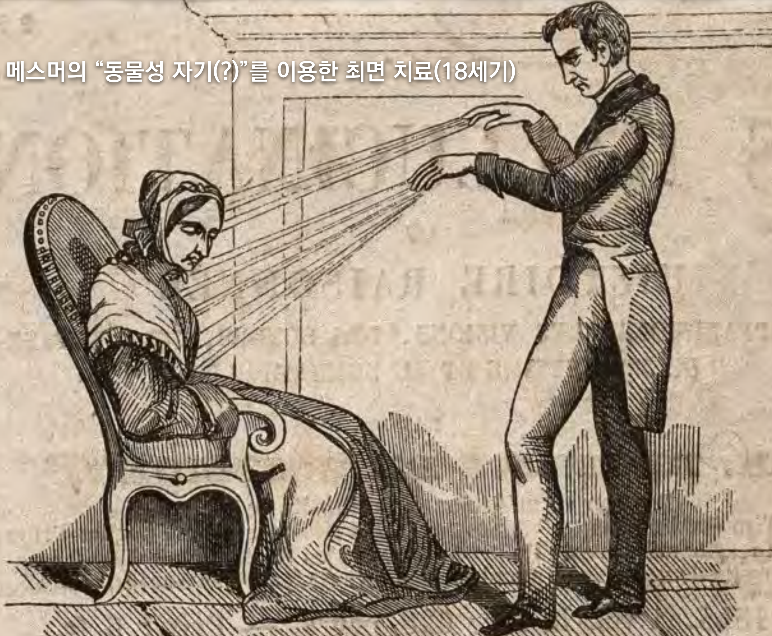
안톤 메스머의 “동물성 자기(?)”를 이용한 최면 치료(18세기)